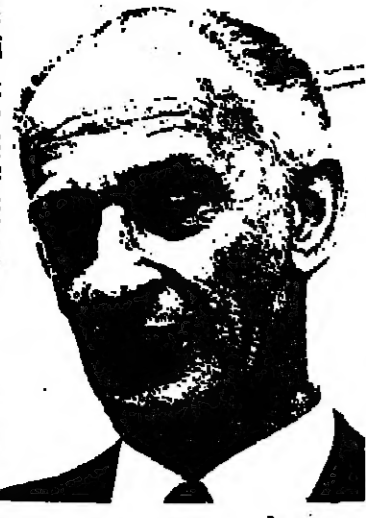
بقلم : يعقوب شمعوني

من عادة المراقب ، والملق الذي يفكر في الاحداث السياسية في العالم الذي يحيط به ، ان يسجل خواطره واحاسيسه بعد الاحداث اذ ان هذا هو طابع عمله . ولكن يحدث احيانا ان «تركض» الاحداث بسرعة كبيرة الى درجة اختلاف الواقع والفكرة ببعضهما ، فتتداخل الاحداث والتعليقات .